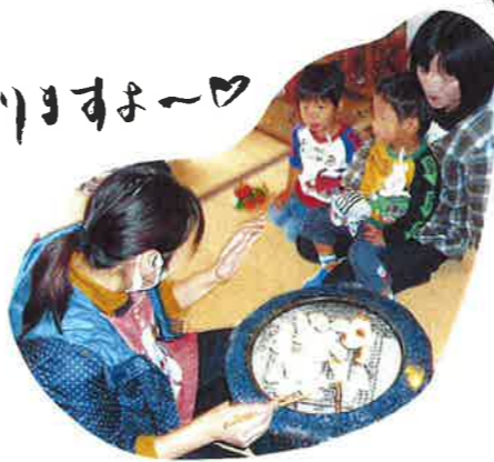
1日は、火鉢を囲んで おんがこコブツ...!

ひだまりには、コブツと先月お目見えた火鉢があります。 寒い日には、おんがこコブツに入ってお火鉢に、火鉢を囲んで わいわい、がやがや...とにぎやかに過ごしています。 冬ごしの味は、なごコブツと火鉢... また、体験して... 牙 ひだまりに来ては いかか〜? きっと、心も体も「ほかほか」になりますよ〜♡