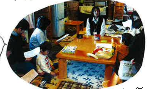
～お話しと絵本を交えてお楽しみください～ 親子で楽しむ...