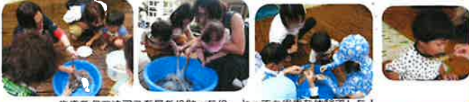
生きたタコやアユを見たり触ったり、とっても貴重な体験でした!

☆☆ ママと一緒に体を動かしてリフレッシュ ☆☆ ~とびちゃんと踊ろうはさこい & リトミック~